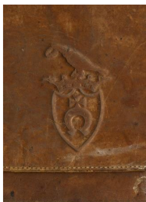
Фрагмент кожаной папки