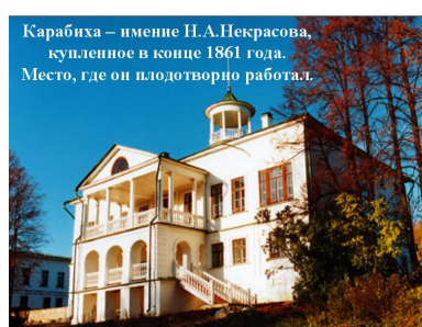
Карабиха – имение Н.А.Некрасова, купленное в конце 1861 года. Место, где он плодотворно работал.