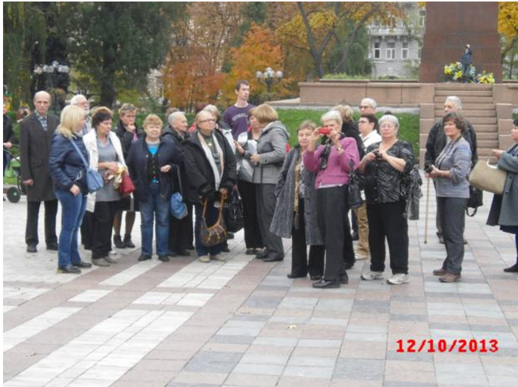
Фото Е.Хохловой, В.Садовской , картина Васнецова URL: http://www.cplire.ru/rus/profcom/excursions.html